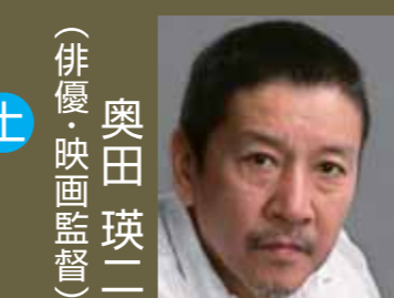
奥田 瑛二 (俳優・映画監督)