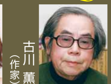
古川 薫 (作家)