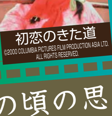
初恋のきた道