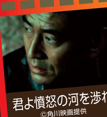
君よ憤怒の河を渉れ