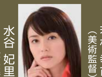
水谷 妃里 (女優)