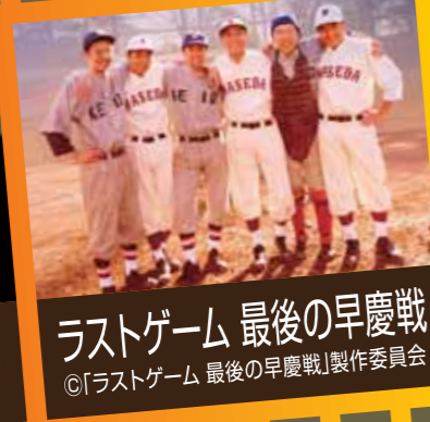
ラストゲーム 最後の早慶戦 ©「ラストゲーム 最後の早慶戦」製作委員会