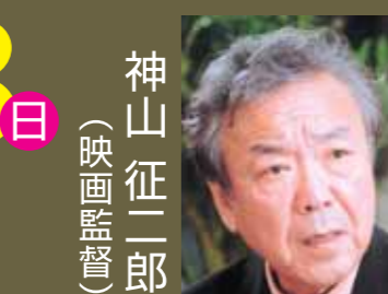
神山 征二郎 (映画監督)